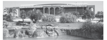
PALÁCIO ARAGUAIA - Praça dos Girassóis