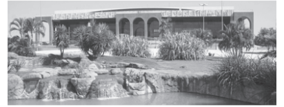
PALÁCIO ARAGUAIA - Praça dos Girassóis