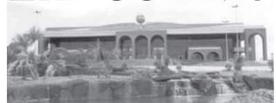
PALÁCIO ARAGUAIA - Praça dos Girassóis