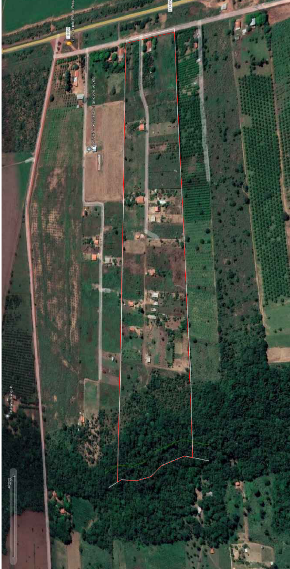
3 CARTA IMAGEM - LOCALIZAÇÃO DA ÁREA EM ABRIL DE 2021 ESC.: Sem Escala

LEGENDA — - CONDOMÍNIO DE CHACARAS IMPERIAL