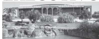
PALÁCIO ARAGUAIA - Praça dos Girassóis