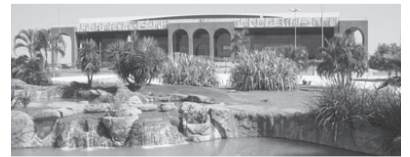
PALÁCIO ARAGUAIA - Praça dos Girassóis