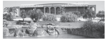
PALÁCIO ARAGUAIA - Praça dos Girassóis