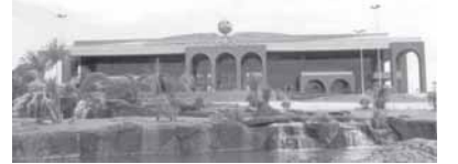
PALÁCIO ARAGUAIA - Praça dos Girassóis