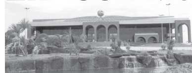
PALÁCIO ARAGUAIA - Praça dos Girassóis