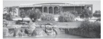
PALÁCIO ARAGUAIA - Praça dos Girassóis