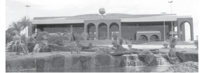
PALÁCIO ARAGUAIA - Praça dos Girassóis