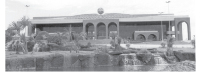
PALÁCIO ARAGUAIA - Praça dos Girassóis