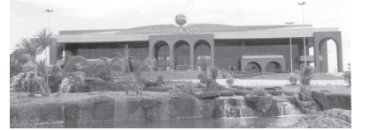
PALÁCIO ARAGUAIA - Praça dos Girassóis