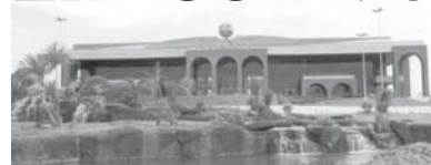
PALÁCIO ARAGUAIA - Praça dos Girassóis