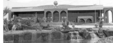
PALÁCIO ARAGUAIA - Praça dos Girassóis