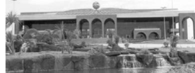
PALÁCIO ARAGUAIA - Praça dos Girassóis