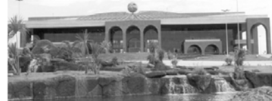
PALÁCIO ARAGUAIA - Praça dos Girassóis